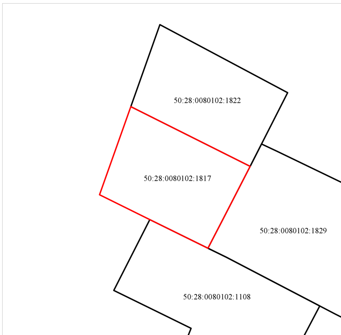
Схема расположения земельного участка в окружении смежно расположенных земельных участков (Ситуационный план)